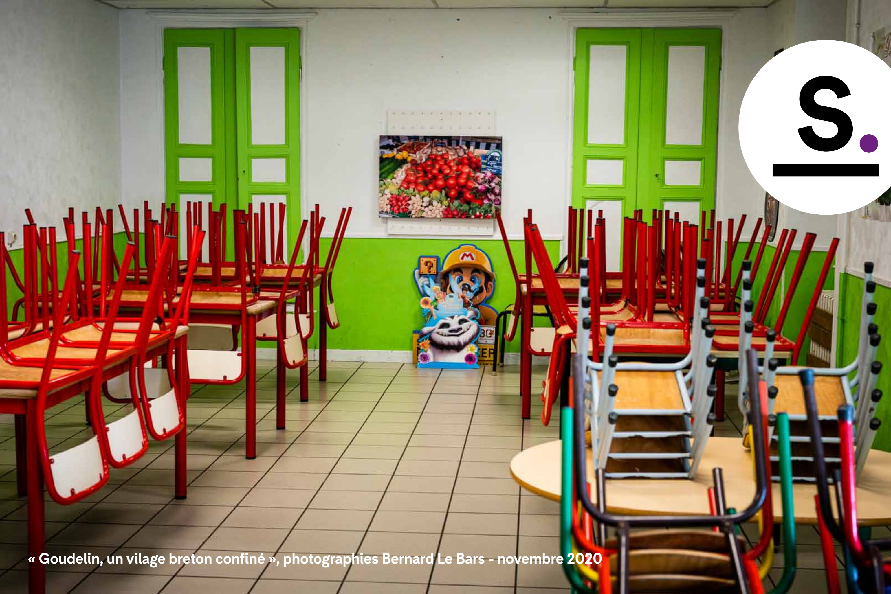
« Gouelin, un vilage breton confiné » - novembre 2020